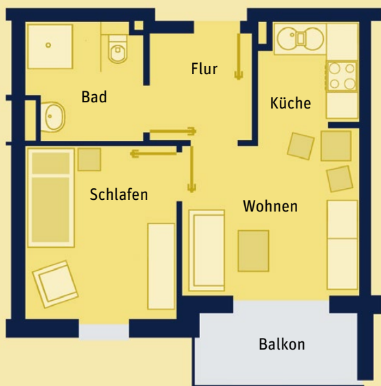
Wohnbeispiel: 2-Zimmer-Apartment mit 52 m 2