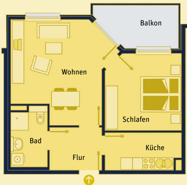
Wohnbeispiel: 2-Zimmer-Apartment mit 59 m 2